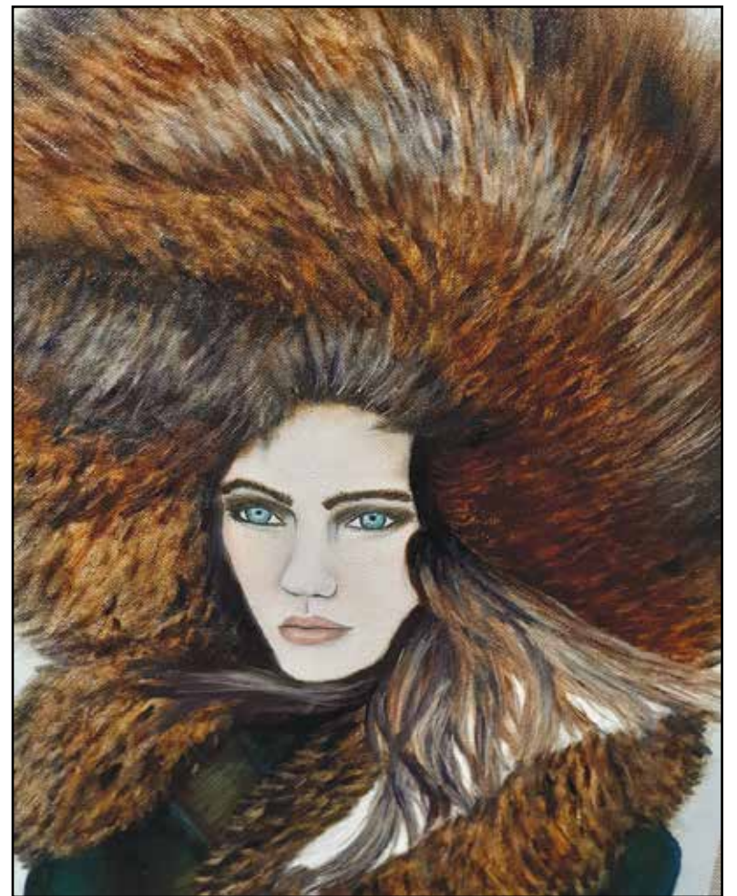
Peinture d'Erin Keatch

est bien fier de contribuer au développement de cette discipline artistique.»