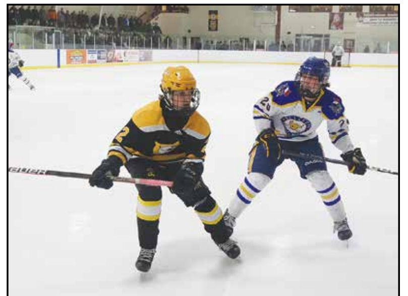
Il y avait beaucoup d'action sur la glace lors du match entre les Patriotes et les Matadors dimanche soir à Cap-Pelé.