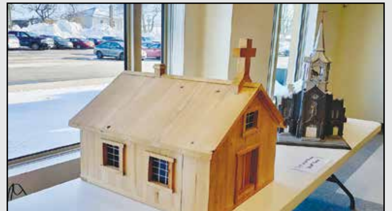
Deux maquettes des églises de Saint-Antoine. Au fond, l'église actuelle et au premier plan, la première église. Construite en 1838, elle servit au culte jusqu'en 1856.

M. Bourque, qui pensait peut-être à l'exemple de la cathédrale de Moncton, a conclu son propos en invitant le public présent à engager une réflexion sur la meilleure façon de préserver le patrimoine, tout en diversifiant sa vocation.