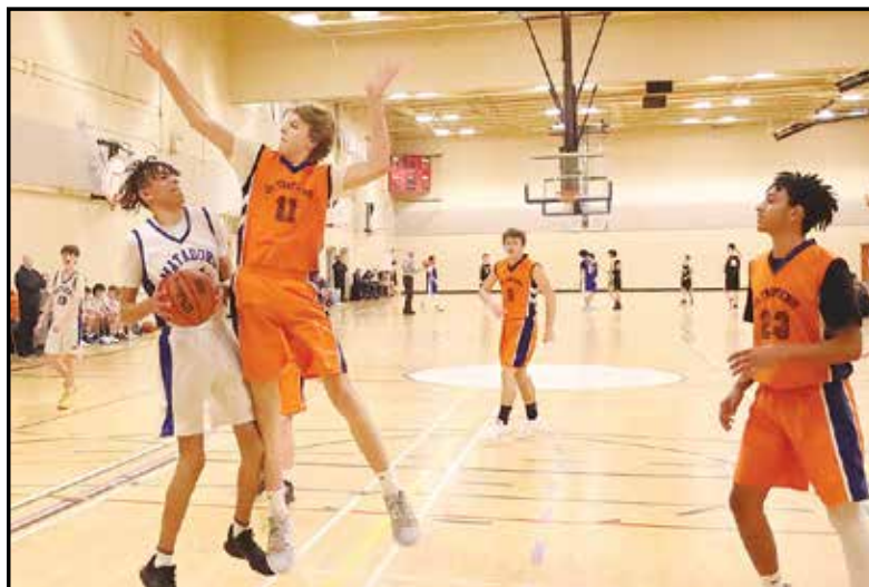
L'action ne manquait pas sous les paniers lors de la finale entre les Matadors (blanc) et les Olympiens (orange).

Le tournoi a réuni les équipes de quatre écoles francophones et les organisateurs espèrent que d'autres s'ajouteront l'année prochaine afin de promouvoir ce sport chez les francophones.