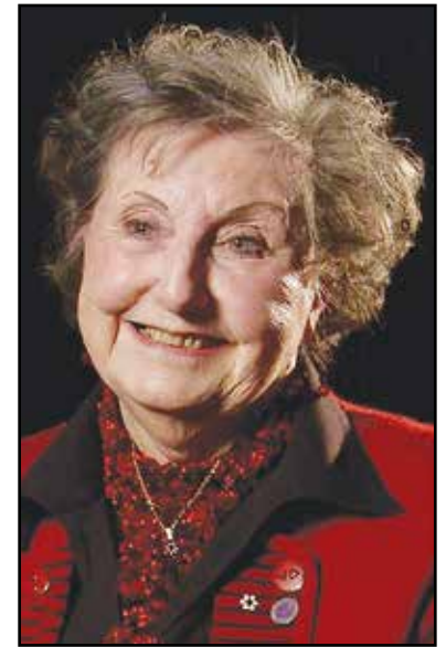
Une grande comédienne, dotée d'un cœur généreux.

Depuis cinq ans, les récits de la Sagouine sont déclinés par