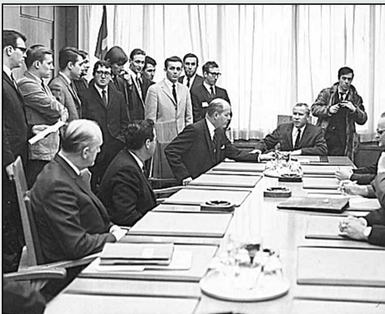
UM-008454 – Le premier ministre Louis J. Robichaud, en présence des étudiants de l'Université de Moncton, qui discute de la grève étudiante qui sévit à cette université en 1968.

Pour plus d'information, visitez notre site web : https://www.umoncton.ca/umcm-ceaac/accueil .