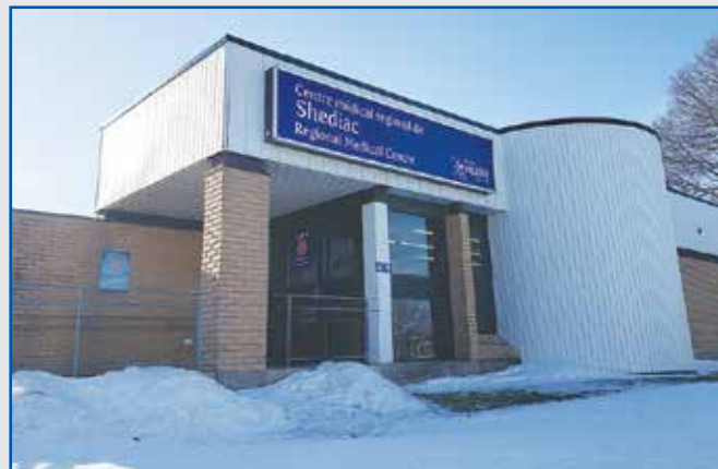
Le Centre médical régional de Shediac, rue Main.