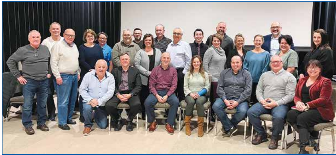
Les représentants du réseau de santé et les élus locaux présents lors de la rencontre à Shediac.