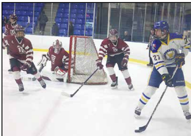
Les Matadors ont roulé à plusieurs reprises autour du filet des Trojans lundi soir.