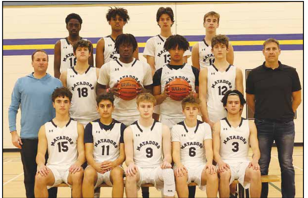
L'équipe des Matadors de Mathieu-Martin au basketball senior.

toire décisive de 88 à 49 contre les Knights de Moncton en janvier. En match hors-concours, les Matadors ont vaincu les Olympiens de L'Odysée 87 à 48 et ensuite avec un gain de 78 à 71 contre McNaughton. L'équipe a joué contre Trimble hier soir et recevra McNaughton jeudi soir à 20h à l'école de Dieppe.